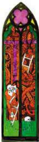
Alberola Vierge au pied de la croix

En collaboration avec le Centre National des Arts Plastiques et les ateliers des maîtres-verriers Duchemin (Paris), Parot (Dijon) et Thomas (Valence)